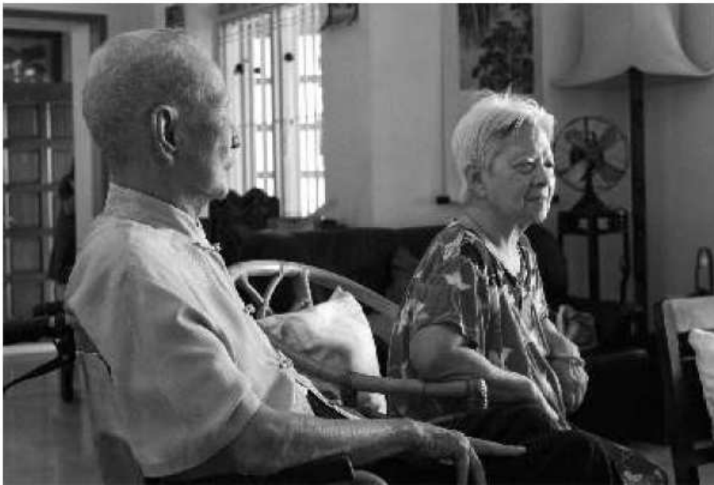
我们敬爱的父亲和母亲